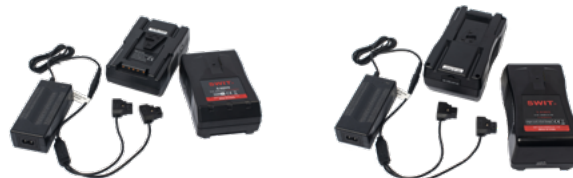
Kits Batteries & chargeur S/M et L

Options de rangement dans le packaging : jusqu'à 3 neo film