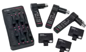
Kit DMX sans fil